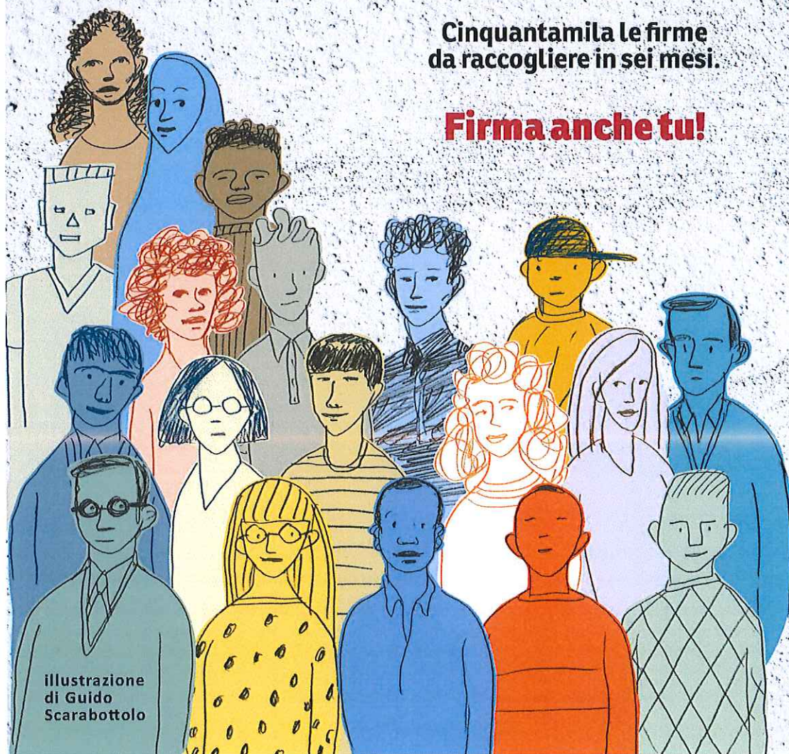
illustrazione di Guido Scarabottolo